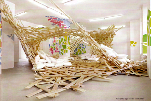
View of the large wooden construction