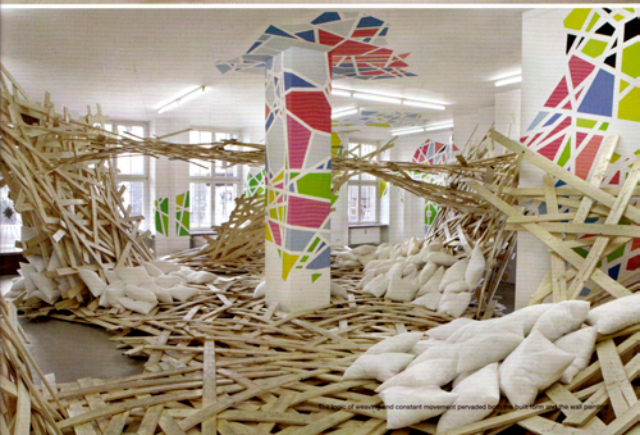
The kind of weaving and constant movement pervaded by the structure and the wall panels